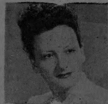
Señora de GUIET