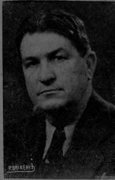
Prof. don Luis Dobles Segreda

Saludamos atentamente, con motivo de haber celebrado su fecha natalicia en días pasados, al señor Ministro de Educación Pública, el distinguido profesor don Luis Dobles Segreda.