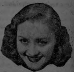
Virginia Dale Paramount Pol.

DE VENTA EN TODAS LAS BOTICAS Y DROGUERIAS