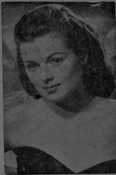
BARBARA HALE, Adorable estrella de Universal - Internacional, sigue los consejos del famoso maestro de maquillaje Max Factor Jr., para acentuar la belleza de sus cejas y pestañas.

Para las horas de oficina, lo mismo que para las actividades normales durante el día, puede usted retocarse un poco las pestañas con